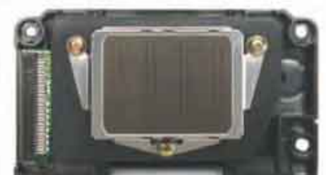
Druckkopftechnologie der Epson Großformatdrucker